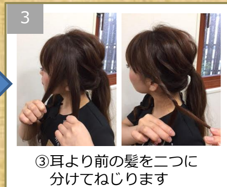
③耳より前の髪を二つに 分けてねじります