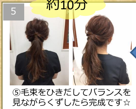
⑤毛束をひきだしてバランスを 見ながらくずしたら完成です☆