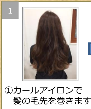
①カールアイロンで 髪の毛先を巻きます