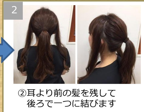
②耳より前の髪を残して 後ろで一つに結びます