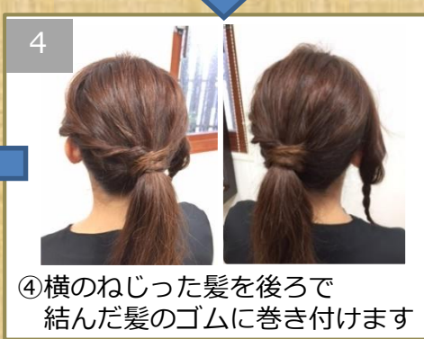
④横のねじった髪を後ろで 結んだ髪のゴムに巻き付けます