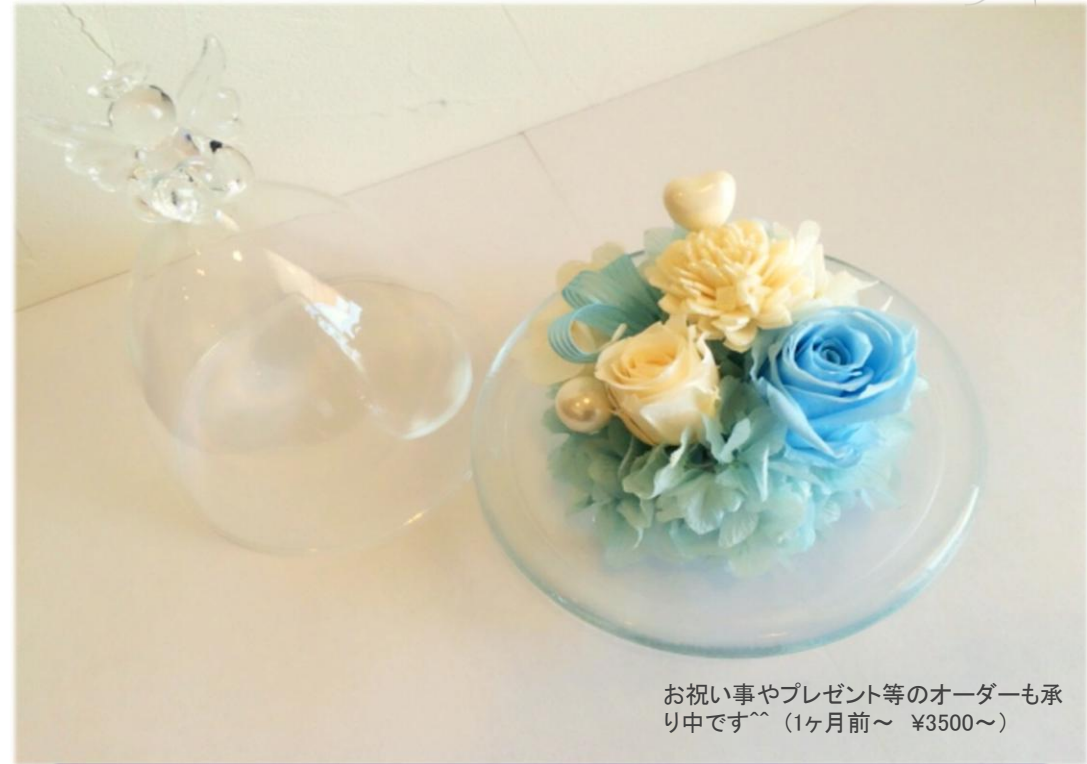
お祝い事やプレゼント等のオーダーも承り中です^^ (1ヶ月前～ ¥3500～)