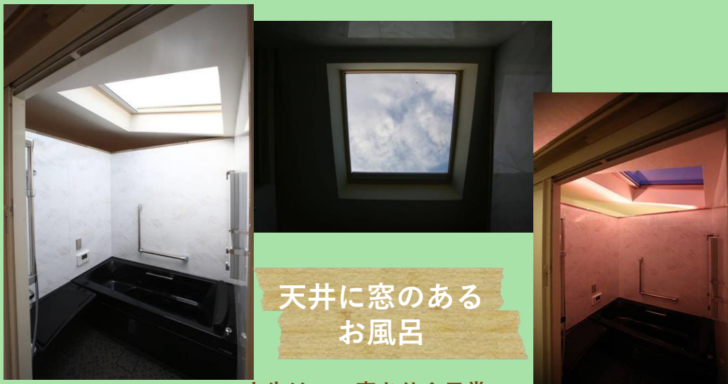
天井に窓のある お風呂

確かにうっすらかもしれないけどお風呂に入りながら皆既月食を見てる人が世界中で何人いるだろうか？温泉宿の露天風呂じゃなくて自宅のお風呂で見られるなんてこのお風呂からはまだまだこれからもいろんなドラマティックなことが起こると思うとワクワクしますね(^^)