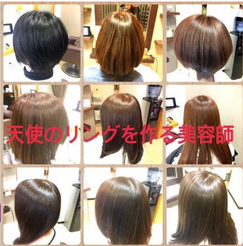
天使のリングを作る美容師

皆さん、髪を乾かす前に、髪をといてから乾かしていますか？ 洗い流さないトリートメントをつけて、くしでといてから乾かすだけで、仕上がりがものすごく変わります♪ くしでとくことで、トリートメントが均一に馴染み、ドライヤーの風も均一に当たるようになるので、ツヤ、まとまり、そして早く乾きます★是非ためしてみてください(^^)