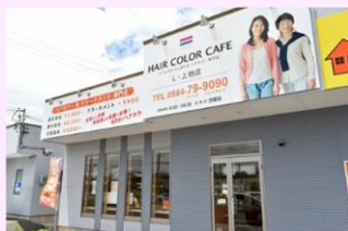
ヘアカラーカフェL上地店です♪

いわゆる普通のカラーは 明るくすることも暗くすることも可能で、色持ちもいい です。ただその反面、アレルギーの原因やヘアダメージの原因ともなります。マニキュア、トリートメントカラー、ヘナなどは表面しか染まらないため、明るくすることができず、色持ちは悪い反面、 頭皮や髪には優しい です。